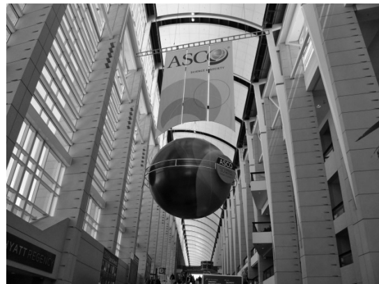
写真1 第50回米国臨床腫瘍学会会場

学会は標準治療となり得る臨床試験結果が発表されるプレナリーセッション、各種がん領域および緩和・支持療法の口頭セッションやポスターセッション、前日に注目された発表のハイライトセッションで構成されていた。