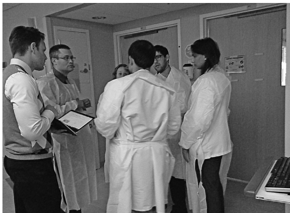
写真3 血液内科病棟ラウンドの様子