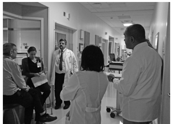
写真 2 骨髄移植チームラウンドの様子