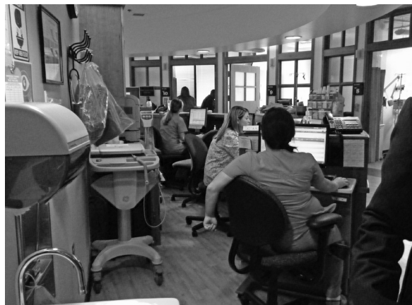
写真4 点滴センター（個室）とナースステーション

教育制度の違いもあり、自院の現状に簡単に取り入れられる事は多くなかったが、生の米国の医療現場を見学できたのは非常に刺激となる経験であった。この経験を、今後自院薬剤部だけでなく広く患者や医療スタッフへと還元していきたいと思う。